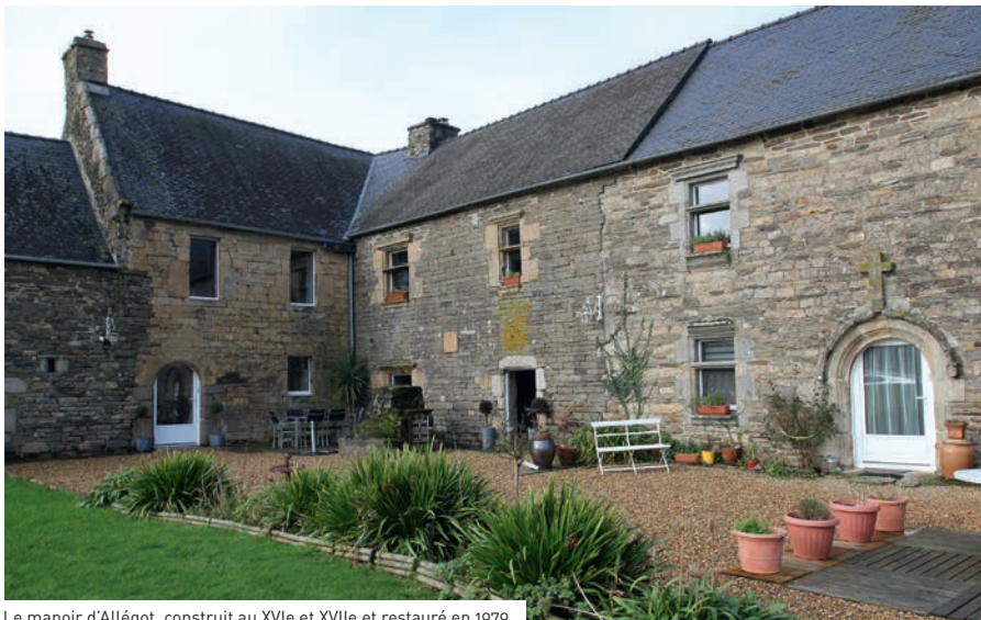
Le manoir d'Allegot, construit au XVI e et XVII e et restauré en 1979.

La belle demeure de Kerlambars, en bon état d'origine possède un très bel escalier de pierres à deux volées droites situé dans l'aile de la façade arrière. On peut également remarquer le fronton au-dessus de la porte ainsi que les fenêtres à moulures.