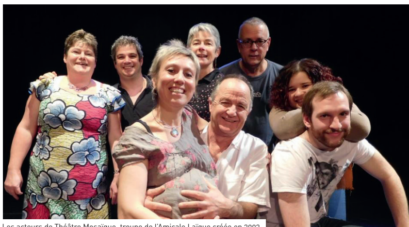
Les acteurs de Théâtre Mosaique, troupe de l'Amicale Laïque créée en 2002.

En plus de jouer pour leur plaisir et pour celui du public, les deux troupes ont également à cœur d'apporter leur soutien à des associations caritatives. Théâtre Mosaique reverse ainsi une part des recettes de chacune de ses représentations aux Restos du cœur tandis que Théâtre sur cour soutient, depuis plusieurs années, de nombreuses associations (Les amis de Franck, La diagonale du souffle...). Les partenariats établis au fil des ans par les deux groupes concernent aussi le monde du théâtre: dans le cadre d'échanges inter-troupes, des liens se tissent entre les compagnies. Plouzané accueille régulièrement des formations des alentours, tandis que celles de la commune ont l'habitude d'aller proposer leur spectacle au Relecq Kerhuon, à Bohars ou ailleurs, assurant alors la promotion de cette passion créatrice de lien social, de plaisir et d'émotions.