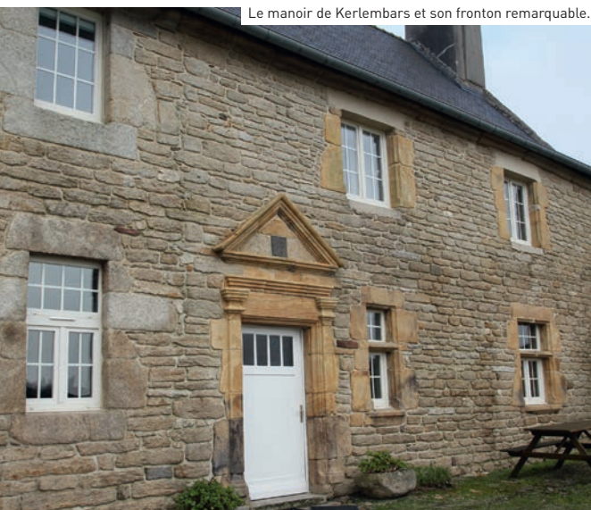
Le manoir de Kerlambars et son fronton remarquable.