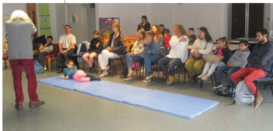
Soirée conte à la Courte échelle

Au sein de l'Espace-Tabarly, l'accent est également mis sur la capacité des ados à se prendre en main : ils sont à la fois le moteur et les organisateurs des activités qu'ils souhaitent entreprendre. En outre, « il n'y a volontairement pas d'espace privatif qui leur soit complètement dédié », précise Pierre Rioualen, responsable de l'espace : cela permet de « favoriser la mixité et l'ouverture d'esprit ». C'est également dans ce but que la Courte Échelle a accueilli, en avril dernier, 2 ateliers organisés dans le cadre du Festival des identités remarquables : jeunes valides et handicapés ont ainsi partagé une soirée conte et un atelier cuisine, contribuant à changer de regard sur le handicap.