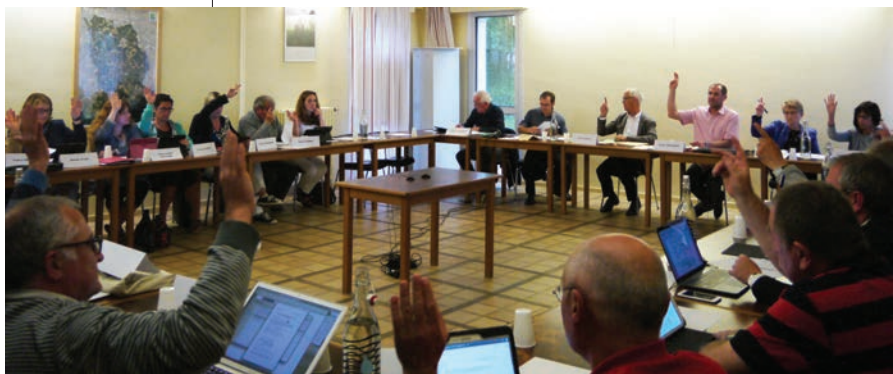
Le dernier conseil municipal dans l'ancienne mairie.

À la fin des années 80, la Poste et le receveur ont déménagé. Les pièces du logement sont devenues des bureaux. Une bibliothèque a été aménagée à la place du guichet de la Poste, le temps de la construction, en face, de la médiathèque François-Mitterrand. Avec le départ de la gendarmerie vers le haut de la rue du 8 mai 1945, l'ensemble du bâtiment était disponible pour les services municipaux et devenait ainsi pleinement la mairie. Son intérieur a ensuite été maintes fois réorganisé au fil des ans et au gré de simples déménagements ou de travaux de plus ou moins grande ampleur. Le bureau du maire est la seule pièce à avoir gardé sa fonction au cours des huit mandats municipaux.