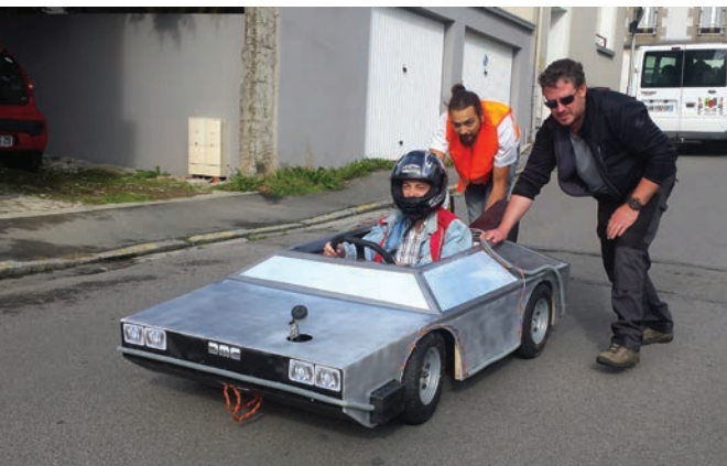
La DeLorean conçue par les jeunes de La Batterie dans les starting blocks.

La Ville de Plouzané tient à ce que les jeunes de la commune puissent accéder à des activités qui leur correspondent. Elle donne ainsi aux deux espaces-jeunes du territoire les moyens de monter des projets qui valorisent et soutiennent les capacités de chacun à agir.