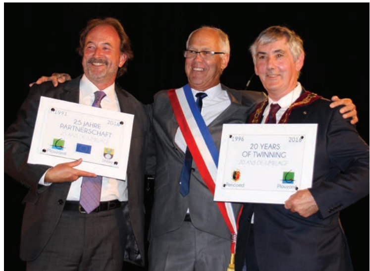
Le Maire de Plouzané (au centre) entouré des représentants des jumelages allemand (à gauche) et gallois (à droite)