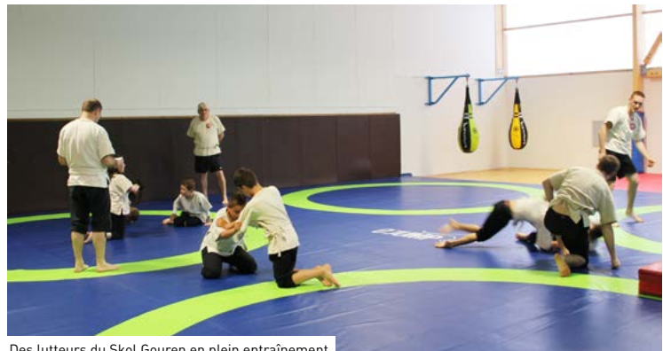
Des lutteurs du Skol Gouren en plein entraînement

Le coût total de cette réhabilitation s'élève à 3 175 000 €, dont 220 000 € de maîtrise d'œuvre et d'études, 2 905 000 € de travaux et 50 000 € d'équipements. Le Conseil départemental a apporté une aide de 900 000 € et l'État, de 200 000 €.