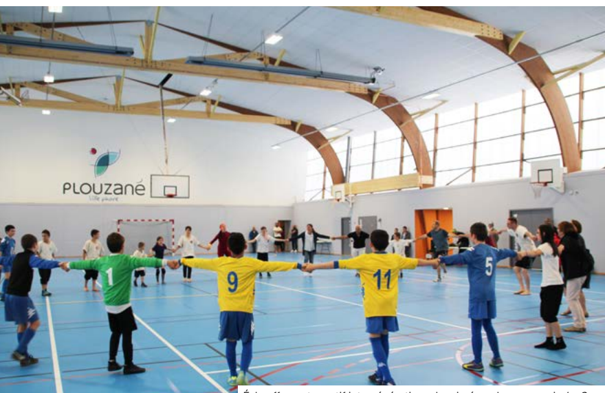
Échauffement sportif intergénérationnel, animé par la compagnie Le Sonar

Petits et grands ont ainsi pu aller à la découverte des 4 salles, portant des noms de lieux-dits de la commune (Dellec, Minou, Mengant et Bodonoù). Dans chacune d'entre elles, des associations ont proposé des démonstrations : gouren, tennis de table, badminton et footsal. Les visiteurs, venus nombreux l'après-midi, ont même pu tester certains sports.