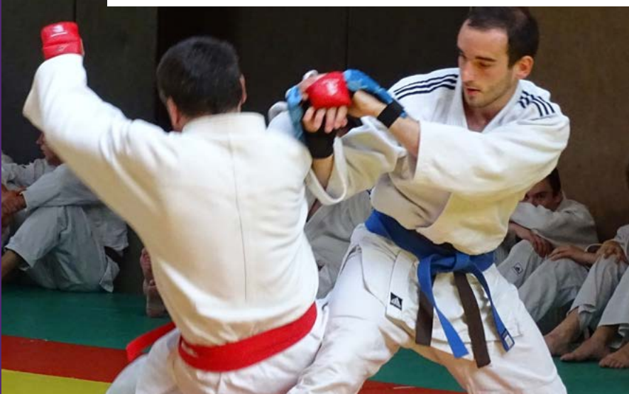
Des jujitsuka en pleine action

Afin de faire connaître les disciplines proposées au sein du dojo, des partenariats ont été créés avec des écoles de la commune, permettant aux enfants développer confiance en soi et respect mutuel. Très ancré localement, le club anime également la section judo au collège Victoire-Daubié et accueille une dizaine d'étudiants de l'IMT Atlantique.