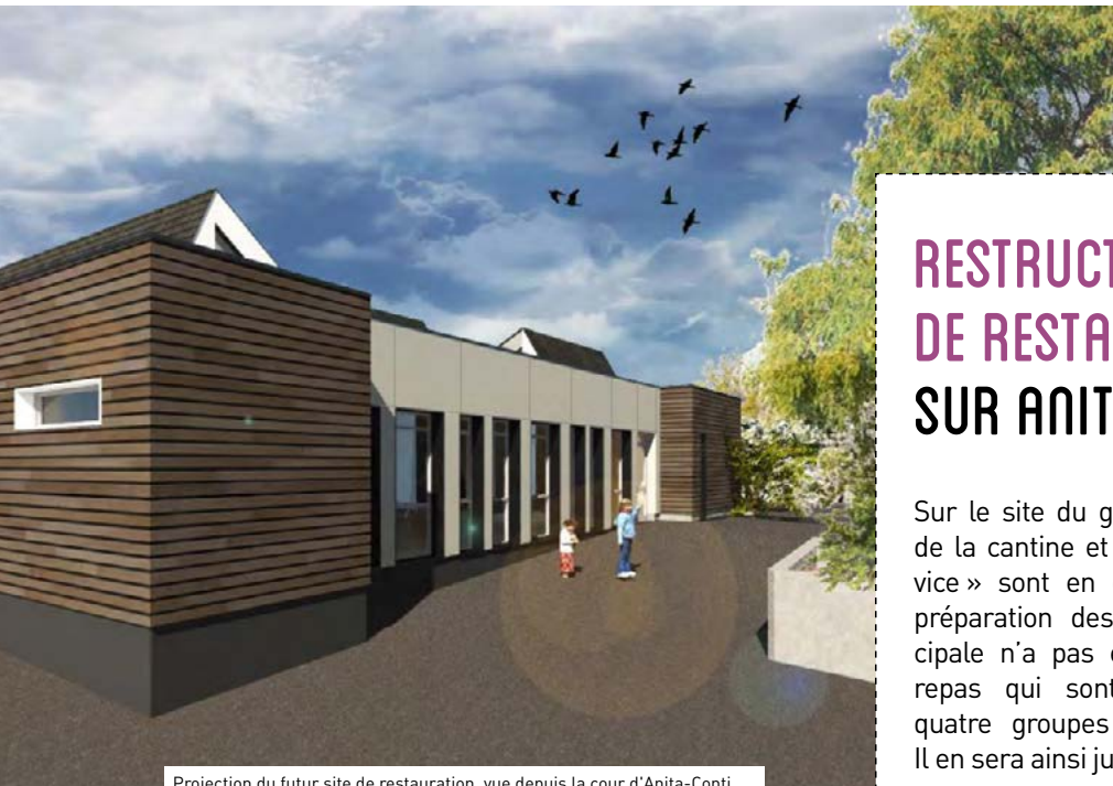
Projection du futur site de restauration, vue depuis la cour d'Anita-Conti