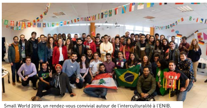
Small World 2019, un rendez-vous convivial autour de l'interculturalité à l'ENIB.