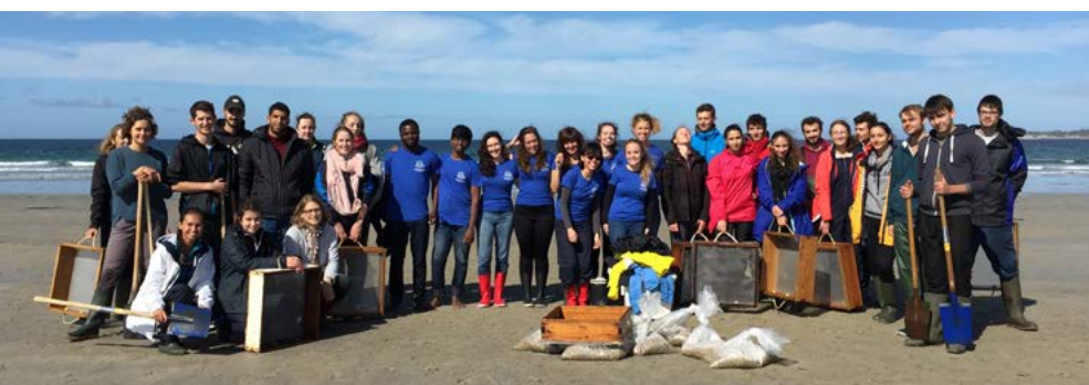
Des étudiants de l'IUEM en sortie autour de la thématique « Ecologie des populations » aux Blancs Sablons.

Pour le moment, j'aimerais découvrir d'autres régions et d'autres pays, afin de renforcer mes compétences techniques et linguistiques, et également d'enrichir mes connaissances culturelles. Mais quand le moment viendra de m'installer quelque part, j'envisagerai sérieusement cette option !