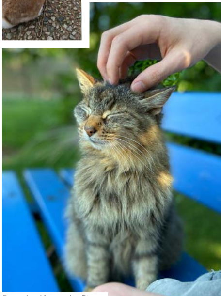
Pascale, 60 ans, Le Bourg