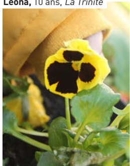
Léona, 10 ans, La Trinité

216 photos reçues durant ces 7 semaines de défi