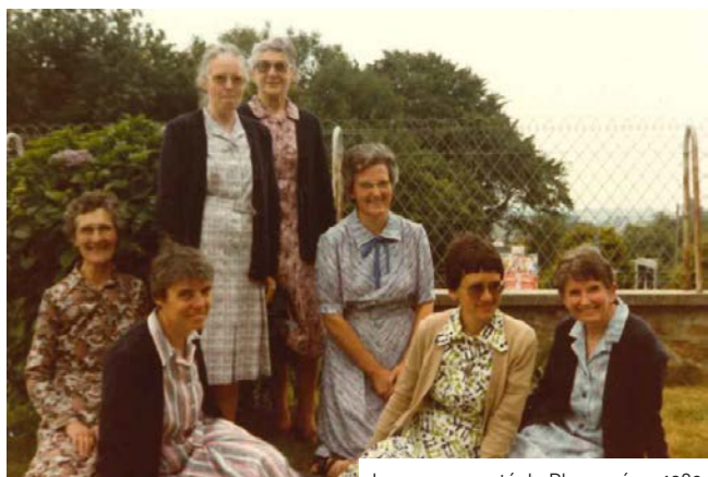
La communauté de Plouzané en 1980.

Au fil des générations, les besoins évoluent. Les religieuses fondent une seconde école, Sainte-Thérèse, à la Trinité. Le nombre d'élèves augmente au fur et à mesure du développement de Plouzané. Les années 70 et 80 voient l'effacement progressif des religieuses au profit d'institutrices laïques dans les écoles.