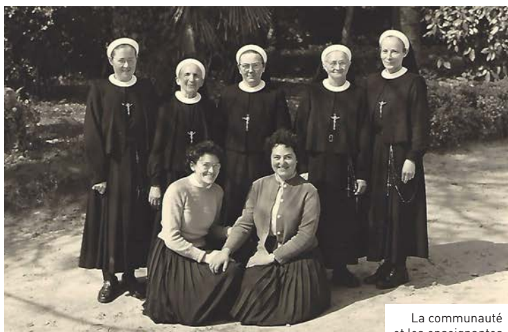
La communauté et les enseignantes vers 1955.

Après 143 ans de présence à Plouzané, les trois dernières religieuses de la Congrégation de l'Immaculée Conception de Saint-Méen-Le-Grand (ou plus couramment sœurs de l'Immaculée) ont quitté Plouzané. Cette présence aura marqué la commune et nombre de ses habitants.