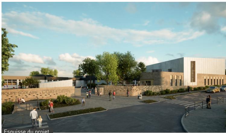
Esquisse du projet.

L 'esquisse livre un aperçu du futur bâtiment qui donnera plus de visibilité à l'école tout en offrant aux jeunes Plouzanéens un espace agréable pour évoluer et s'épanouir. L'objectif est de permettre un démarrage des travaux au printemps prochain. ●