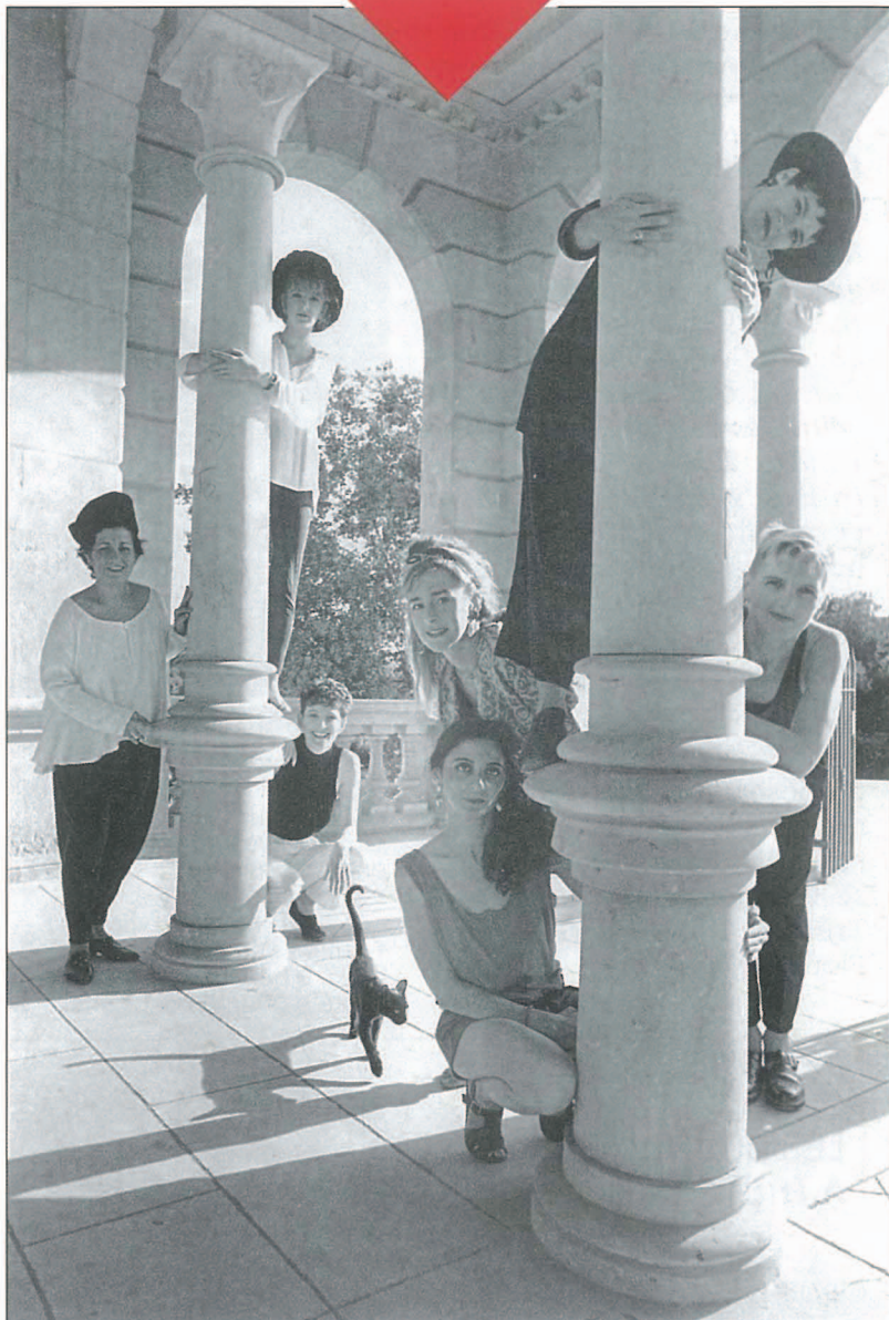
Stupendams interprète des chansons à capella avec quelques touches de percussions.

Stupendams est un groupe vocal formé, début 1989, par sept femmes d'origines géographiques différentes : Grande Bretagne, Catalogne, Nouvelle Zélande.