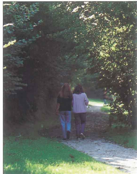
Le cadre de vie, point fort de Plouzané.

Si certaines réponses appellent une interprétation en terme de sentiments, d'autres appellent la franchise, par exemple quand il s'agit d'estimer le temps de réaction de la "machine administrative" pour la réalisation d'actions concrètes. Même si d'excellentes raisons peuvent expliquer quelquefois des délais surprenants, ce genre de vérité n'est pas particulièrement agréable à entendre. Aussi, pour essayer d'éviter que les délais ne dérapent et que certaines dispositions prises durant les visites de quartier ne passent aux oubliettes, un comité de suivi des travaux a été mis en place au mois d'octobre. Néanmoins, on peut déjà voir dans nombre de quartiers, les réalisations des services techniques consécutifs aux demandes des habitants enregistrées au