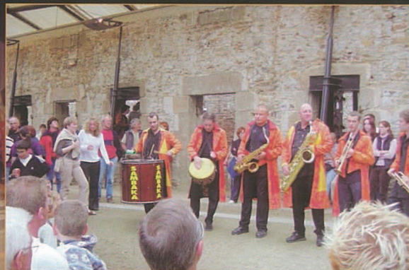
On aurait pu se croire au Carnaval de Rio avec Sambaka...

"Le public était venu en masse pour écouter les célèbres Sonorien Du"