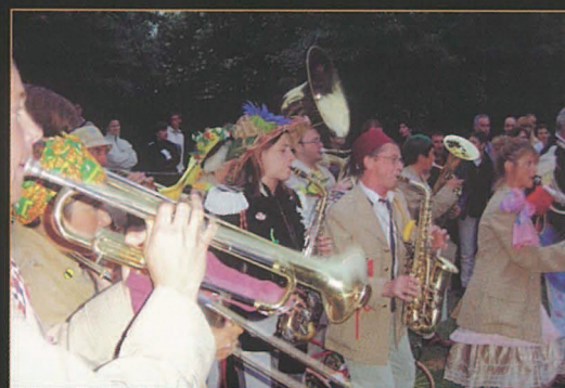
La Bonne humeur de la Fanfare Zébaliz a lancé la deuxième édition du Dellec en Juillet.

Le Dellec en juillet : une manifestation qui a fait ses preuves et dont la renommée est désormais bien installée !