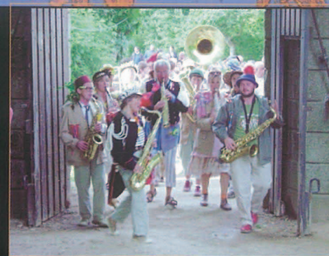
Chaque soirée débutait par un accueil en fanfare.