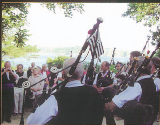
6 Pas de soirée celtique sans les sonneurs du Bagad Adarre !